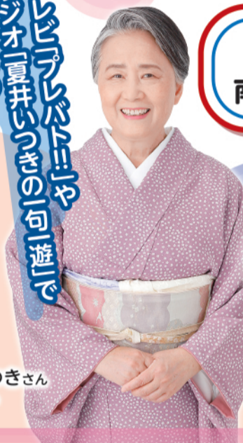
俳人 夏井いつきさん